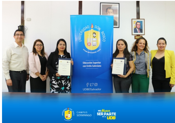
Imagen 9 Firma del convenio entre Muchas Más y la Universidad Don Bosco

La Universidad Don Bosco es una de las mejores universidades del país, especializada sobre todo en áreas técnicas donde en la mayoría de los casos las mujeres son todavía minoría. Este convenio permitirá no solo que las becarias de Muchas Más paguen los aranceles mínimos, sino que reciban atención personalizada mediante clases de refuerzo y tutorías para que logren sacar el máximo provecho de sus estudios.