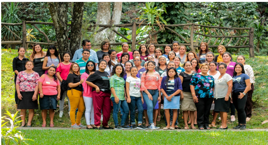
Imagen 1 Taller anual con becarias, madres y padres. Enero 2020.

Para finalizar, se dio lectura y se socializó la carta de compromiso de las familias y de las becarias, cerrando con un acto simbólico en el que todas y todos firmaron su compromiso.