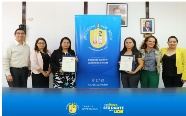
Ilustración 23 Firma del convenio con la Universidad Don Bosco

Es una de las mejores universidades del país, especializada sobre todo en áreas técnicas donde en la mayoría de los casos las mujeres son todavía minoría. Este convenio nos permitirá no solo que las becarias de Muchas Más paguen los aranceles mínimos, sino que reciban atención personalizada mediante clases de refuerzo y tutorías para que logren sacar el máximo provecho de sus estudios.