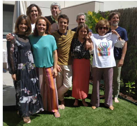
Ilustración 18 Participantes en una de las reuniones de sensibilización en Alcobendas

Nuestra intención es seguir ampliando nuestra visibilidad en nuestro municipio y contribuir así a incrementar la solidaridad con El Salvador y con los países del Sur en general