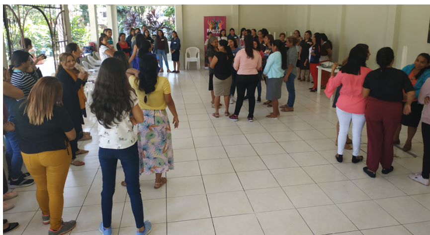
Ilustración 14 Primera reunión anual 2020 con todas las becarias y sus familias