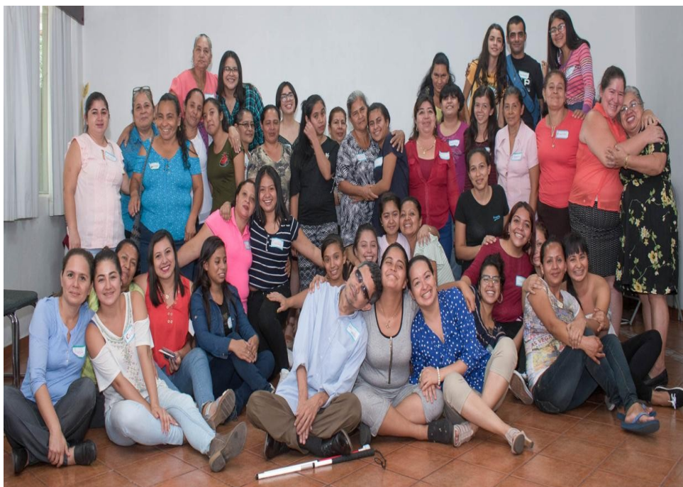
Ilustración 9 Las becarias con sus madres y padres disfrutando de un rato de alegría

En total fueron 12 talleres, uno de ellos estuvo dedicado especialmente a las madres, padres y/o referentes familiares de las becarias, puesto que para nosotras es importante que las familias se involucren en el proceso de formación y se comprometan a apoyarles emocionalmente.