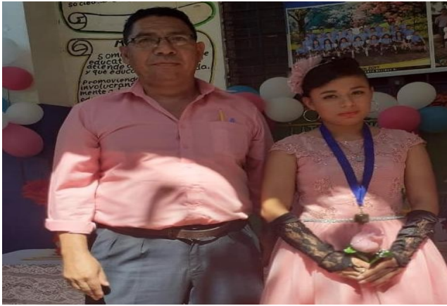
Ilustración 8 Rina en su graduación con el director de la escuela

“Mi familia y yo estamos muy contentos y agradecidos con Muchas Más por el apoyo que nos brindan. En algún momento creí que no sería posible lograr este sueño, pero gracias a mi esfuerzo y a su apoyo, me siento preparada para iniciar mi bachillerato y luego ir a la universidad. Sueño con llegar muy lejos y ser una mujer profesional.”