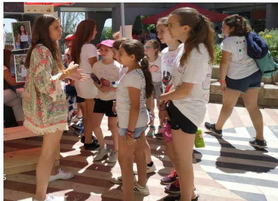
Ilustración 15 Voluntarias de Muchas Más explicando el trabajo que hacemos a las niñas del Liceo Francés